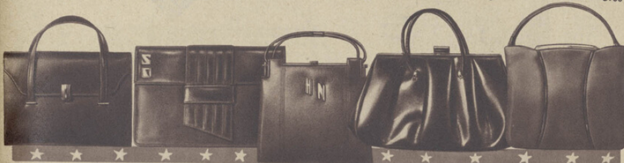
57-29. POCLETTE box-calf noir et coloris mode. "EXCEPTIONNEL". 65.