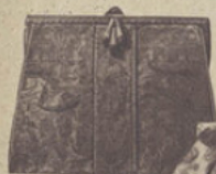
57-40. TORPILLE lamée, doublée satin, fermoir fantaisie. 100.