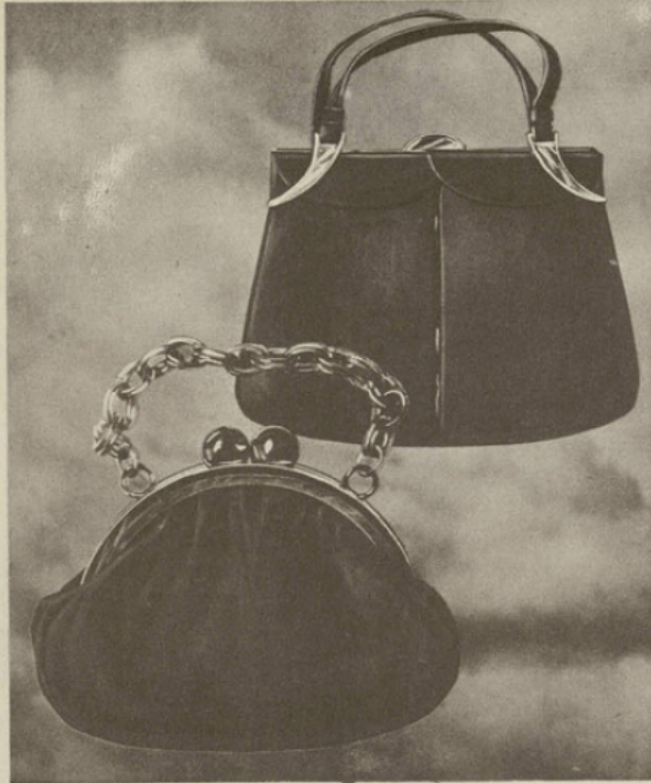
← 57-17. SAC daim noir, liseré verni.