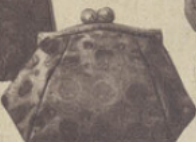
57-39. SAC DU SOIR en lamé, doublé satin. 50.