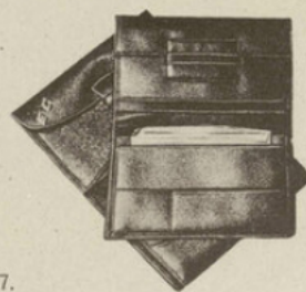
57-41. PORTEFEUILLE phoque noir ou marron. 0 m 15.