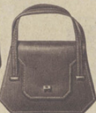
57-48. SAC FILLETTE box-calf, coloris mode. 49. La lettre. 5.