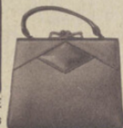
57-47. SAC FILLETTE maroquin, coloris mode. 35.