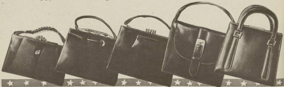
57-18. SAC 3 parts, box-calf noir ou marron. EXCEPTIONNEL. 45. La lettre. 3.