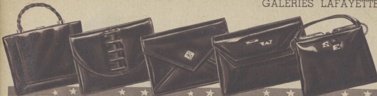
57-21. SAC veau verni noir ou box-calf, coloris mode. "EXCEPTIONNEL". 110.