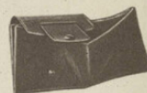
57-44. PORTE-MONNAIE "Clajan", modèle breveté, box-calf noir, marine ou marron.