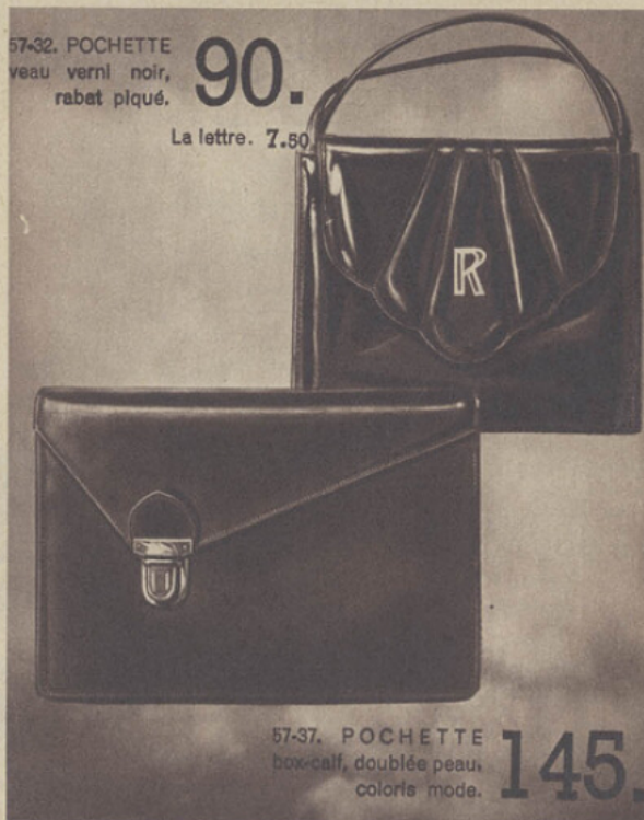
57-32. POCLETTE veau verni noir, rabat piqué. 90. La lettre. 7.50