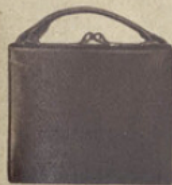
57-46. SAC FILLETTE façon cuir, coloris mode. 12.50