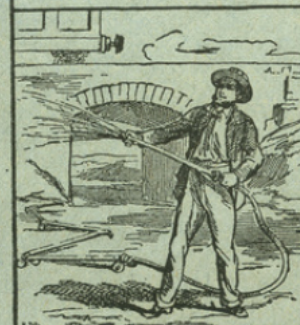
LES TUYAUX & LES RONDELLES