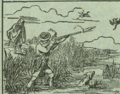
CHAUSSURES & VÊTEMENTS