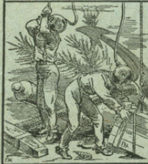
LES ÉTOFFES IMPERMÉABLES