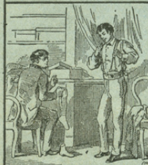
LE FIL DE CAOUTCHOUC