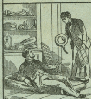
LES ARTICLES DE CHIRURGIE