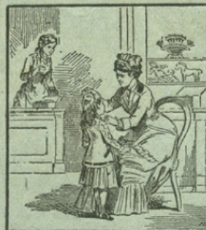
LE CAOUTCHOUC DURCI