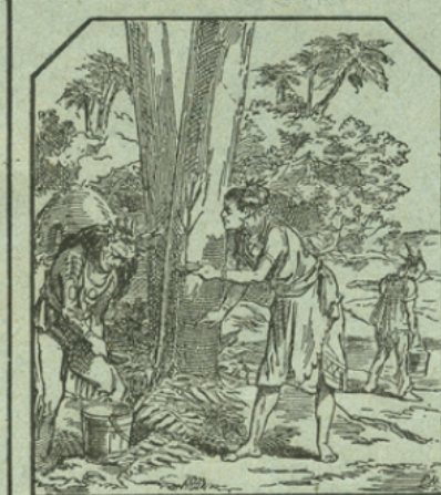
LA RÉCOLTE DU CAOUTCHOUC