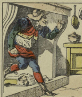
Monsieur Croquemitaine descend tout à coup par la cheminée.