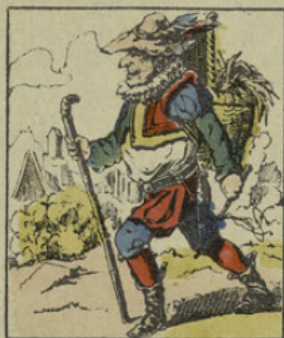
Monsieur Croquemitaine, fait sa tournée pour attraper les enfants méchants.