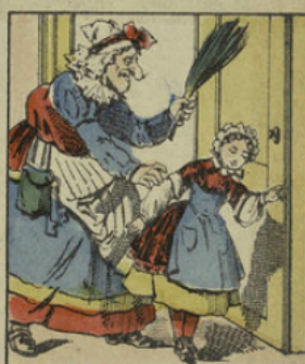
Madame Croquemitaine surprend une petite curieuse qui écoute à la porte du cabinet de son papa.