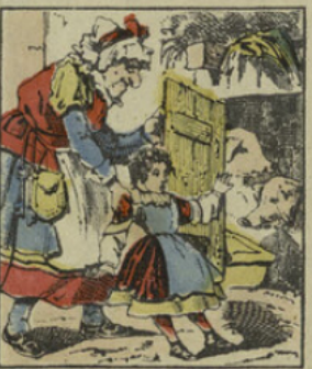
Madame Croquemitaine fait coucher les petites filles malpropres, avec les cochons.