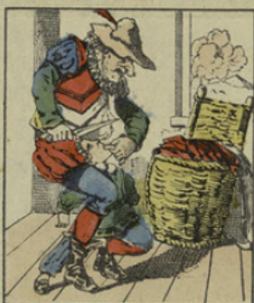
Monsieur Croquemitaine coupe la langue aux petits menteurs.