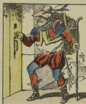
Toc toc... y a-t'il des enfants méchants, désobéissants, paresseux, gourmands, menteurs??