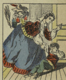
Prenez garde Monsieur le méchant Monsieur Croquemitaine vous entend!..