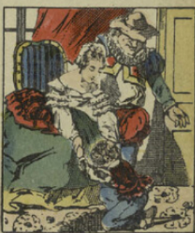
Monsieur Croquemitaine ramène à sa maman un petit garçon corrigé et repentant.