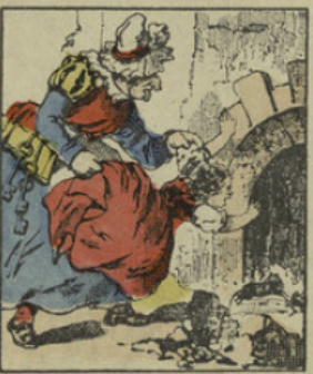
Madame Croquemitaine précipite dans le tron aux rats une petite fille méchante, incorrigible.