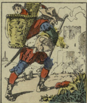
Monsieur Croquemitaine emporte deux petits vauriens dans sa prison.