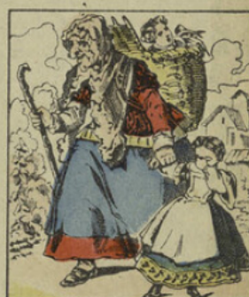
Allons! allons! vite en prison, chez Madame Croquemitaine.