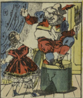
La petite désobéissante a ouvert le carton; tout à coup Croquemitaine s'élance, il était caché dedans.