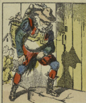
Monsieur Croquemitaine écoute à la porte des enfants méchants.