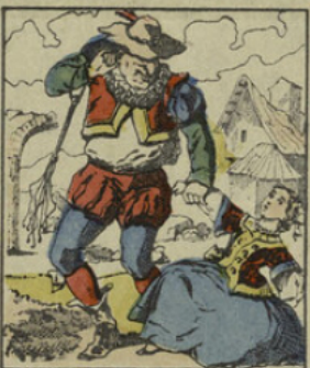
Hum! hum! voilà mon petit doigt qui me dit que vous êtes menteuse.