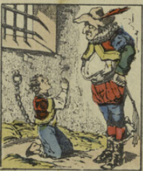
O pardon! pardon! Monsieur Croquemitaine, je n'y ferai plus, je serai bien sage!!