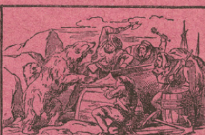
PÊCHEURS ATTAQUÉS PAR DES OURS