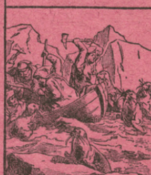
LA PÊCHE DU MORSE