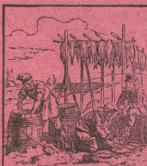
LA PÊCHE DE LA MORUE

Extrait de l'Imagerie des connaissances utiles par Ad. LINDEN