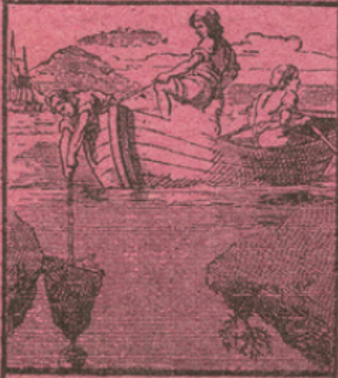
LA PÊCHE DU CORAIL