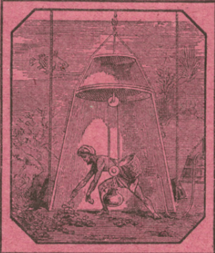
LE PÊCHEUR DE PERLES