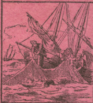
LA PÊCHE DU HARENG