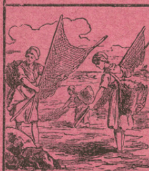
LA PÊCHE DES CREVETTES