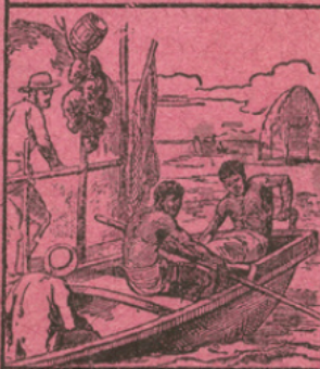
LA PÊCHE DE L'EPONGE