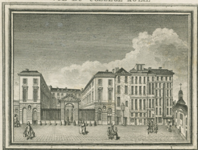
et de la place de Cambrai jusqu'à S t -Benôit.