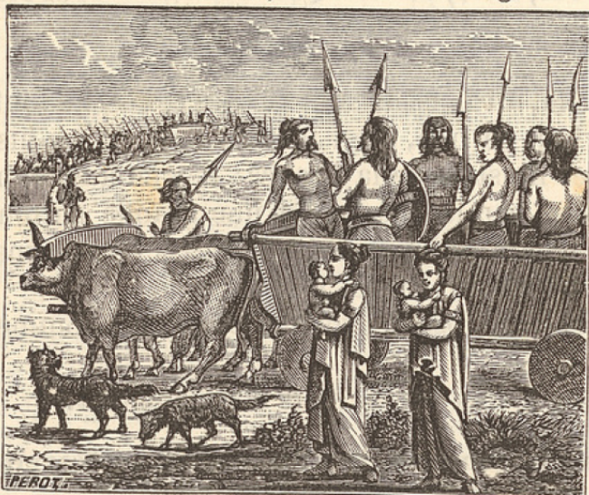
CHARIOT DE GUERRE DES GAULOIS. — Nos ancêtres de la Gaule aimaient beaucoup la guerre et les voyages. Ils s'assemblaient par grandes multitudes ; les uns montaient sur des chars, les autres allaient à pied, et ils partaient ainsi à la conquête de lointains pays. Dans les batailles, ils lançaient des flèches et des javelines du haut des chars comme du haut de tours roulantes.

Il parla si éloquemment de son projet à ses compagnons que tous jurèrent de mourir plutôt que de subir le joug romain. En même temps, ils mirent à leur tête le jeune guerrier et lui donnèrent