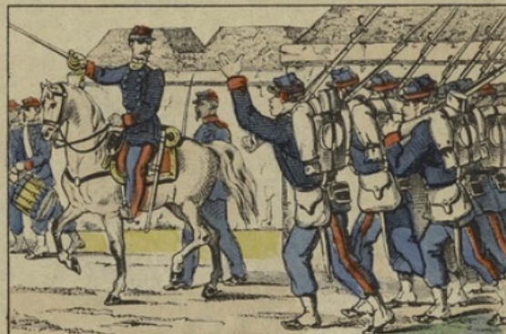
Les gardes mobiles partant pour les avant-postes.