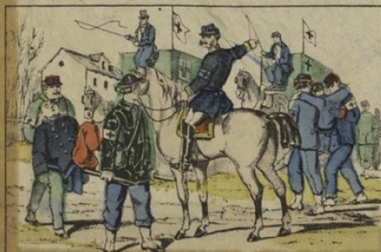
Les ambulances de la presse. Imagerie d'Épinal. — PELLERIN, imp.édit. (Déposé)