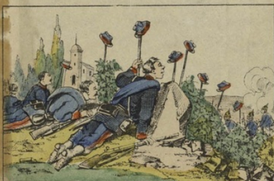
Ruses des mobiles à Argenteuil.