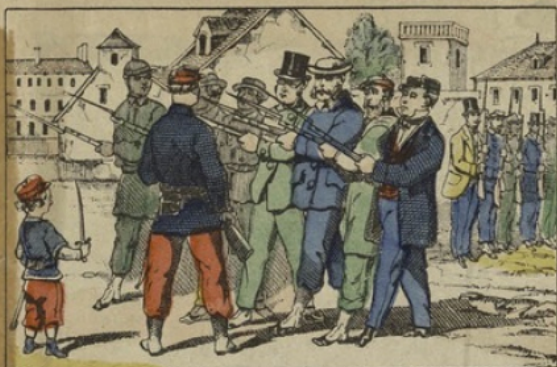
Les gardes nationaux faisant l'exercice.