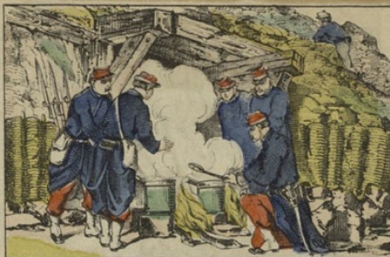
La cuisine dans les casernes.