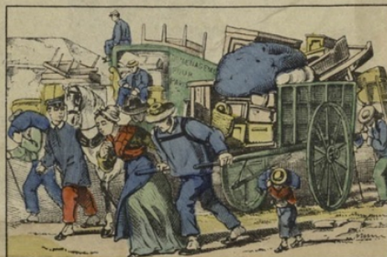
Les gens de la banlieue rentrant dans Paris.