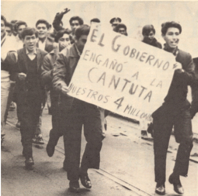
Les « réformateurs » étudiants d'Amérique du Sud valent bien nos « enragés ».

Les gens de droite la dénoncent souvent comme une officine de subversion. Les gouvernements « forts » la ferment, ou du moins y « interviennent » et prétendent en modifier les statuts par voie autoritaire. La gauche (libéraux et radicaux) se regroupent alors pour la défendre — avant de se diviser à nouveau lorsqu'il s'agit de s'en répartir le contrôle.