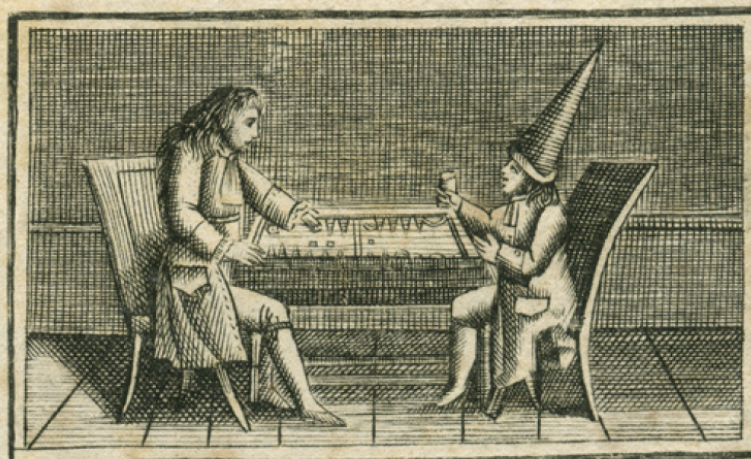
De la passion du jeu.