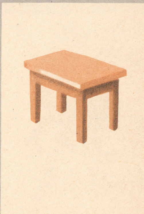
L'alène et ses amis.