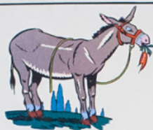
ca di est un â ne