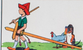
ré mi a u ne é pé e