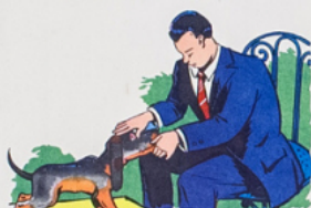
pa pa ta po te la têt e de to bi