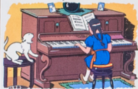
a li ne tape les no tes du pi a no