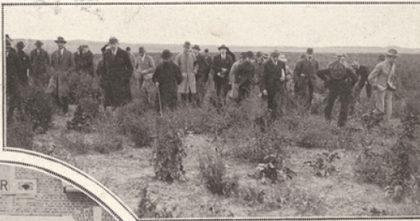
des graines de betteraves de Montescourt-Lizerolles. aux futurs ingénieurs agricoles.

Il est regrettable de penser qu'avant la guerre 80 % de la production des graines de betteraves sucrières de France provenaient de maisons allemandes, qui s'étaient spécialisées dans cette production. Aujourd'hui notre sol va pouvoir lui-même fournir les graines, qui permettront de redonner aux plaines du Nord leur prospérité de jadis et d'assurer à notre pays sa propre culture sucrière.