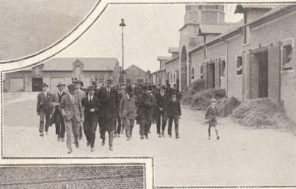
La ferme modèle, qui s'élève aujourd'hui sur le sol maintenant ensemencé et prospère.

Professeurs et disciples parcoururent les différents champs de betteraves, élites destinés à produire les plançons pour l'année prochaine, porte-graines, pour l'année en cours et admirèrent la régularité et la remarquable uniformité des types ; ils furent vivement intéressés par les champs d'expérience, institués dans le but de vérifier la continuité de la transmission des qualités de têtes de