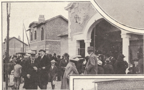
Au cinéma, une fête familiale fut organisée au profit des propriétaires des jardins ouvriers.

Grignon, après ceux de l'Institut Agronomique et de l'Ecole des Industries agricoles de Douai, ont pu constater, lors de leur récente visite à Montescourt.