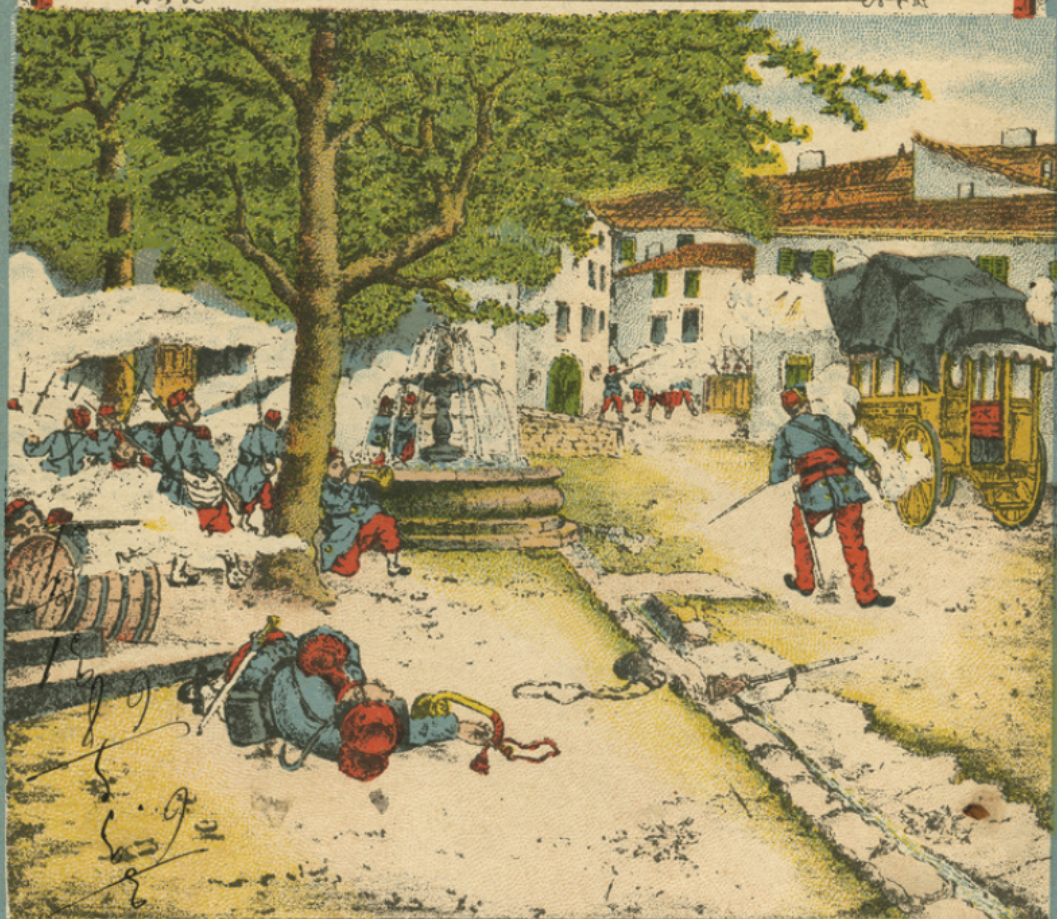
Voisard. Surprise dans un village Lorrain. Propriété de l'Éditeur.