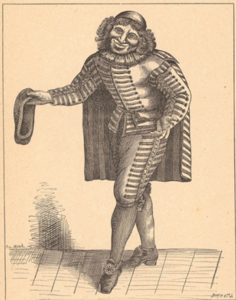
Le vray Portrait de M de Molière en Habit de Sganarelle.