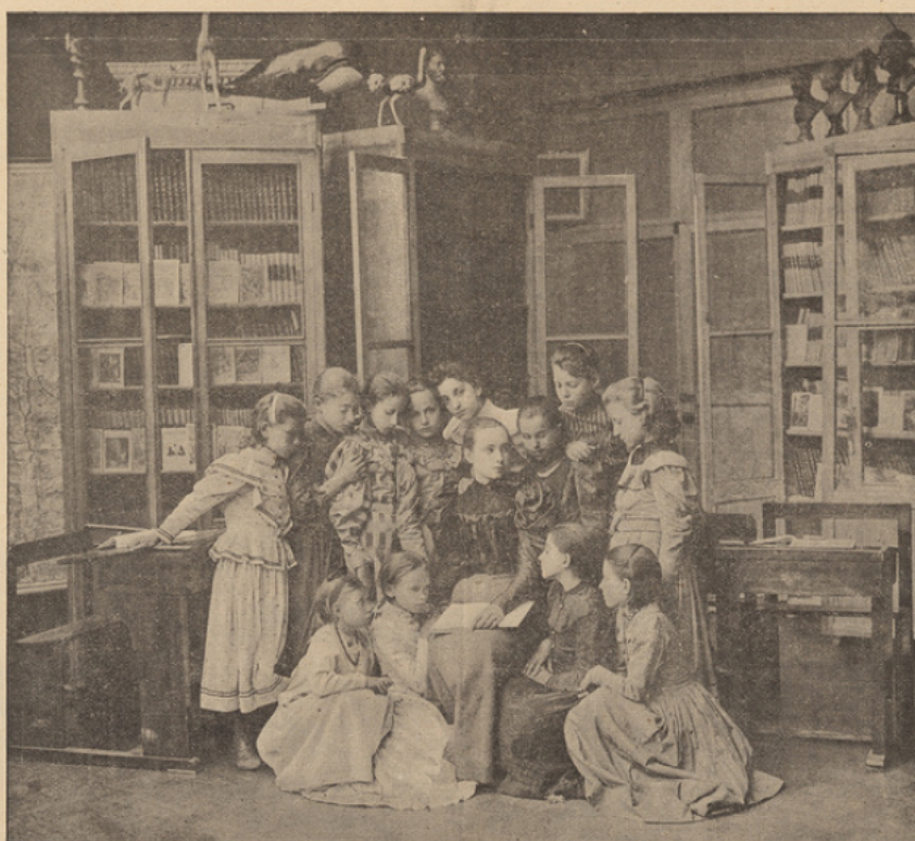
Un groupe à l'école de Kharkow, pendant le commentaire d'une lecture populaire.