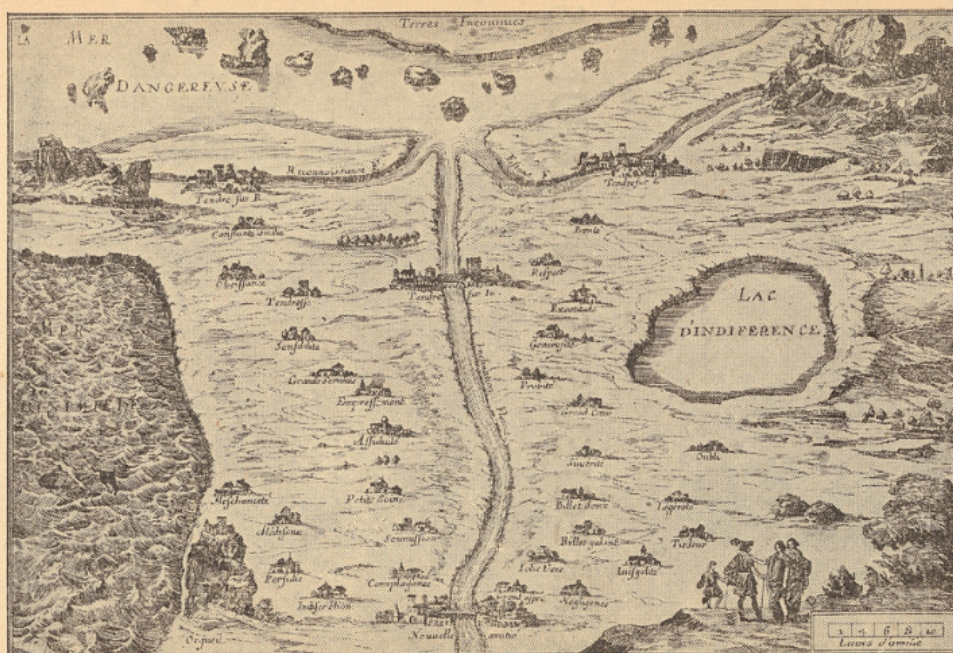
LA CARTE DU TENDRE

dressée par Magdeleine de Scudéry et publiée dans son roman de Clélie (1656-1660).