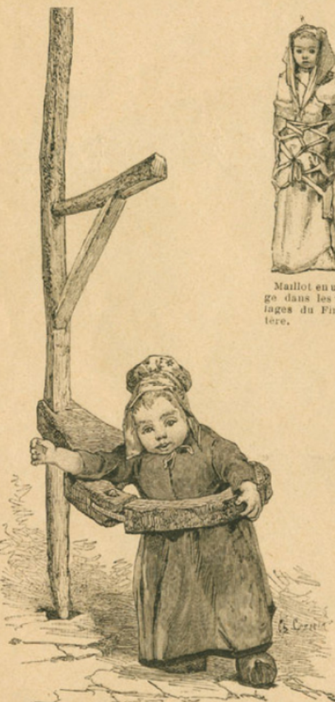
Le viroulet, tourniquet pour la garde des enfants