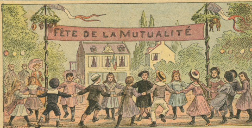
N° 9. — LA MUTUALITÉ EN FRANCE.

Les sociétés de secours mutuels ont pour but de venir en aide à ceux qui, par suite d'un accident, d'une maladie ou de toute autre éventualité, déterminée dans les statuts de l'association, sont privés des fruits de leur travail quotidien. La Fédération nationale mutualiste groupe toutes les sociétés françaises de secours mutuels en un faisceau compact de 17.500 sociétés comprenant 3 millions et demi de membres, dont l'extension continue résout le grand problème de la réduction des risques. L' "Union pour la vie", telle est la devise des mutualistes.