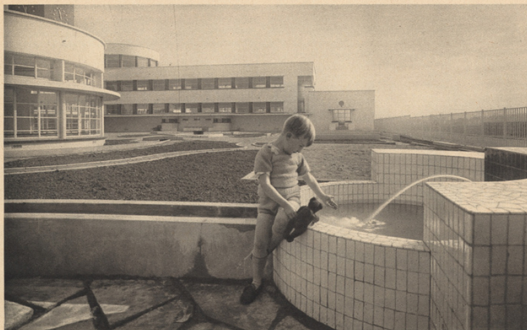
ÉCOLE MATERNELLE. DE DIMENSIONS TRÈS VASTES, LA COUR EST POURVUE DE PETITS BASSINS AVEC RUISSEAU DONT LES SINUOSITÉS PARCOURENT LES PELOUSES ET LES JARDINS DE FLEURS.