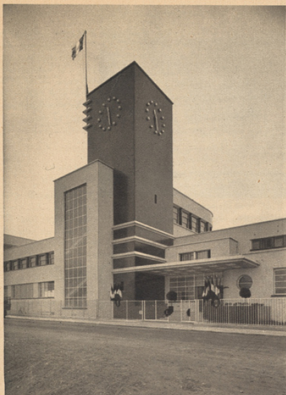
DOMINANT LE GROUPE, LA TOUR ROUGE AVEC SON CADRAN HORLOGE.