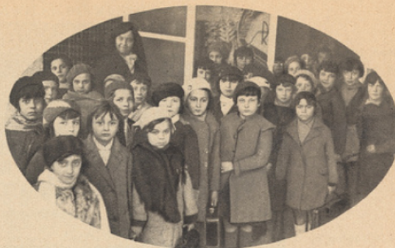
LA SORTIE DES FILLES.