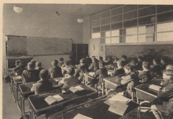
UNE CLASSE DE GARÇONS. LES CLASSES SONT PRÉVUES POUR 40 ÉLÈVES ELLES ONT EN MOYENNE 53 MÈTRES CARRÉS DE SURFACE.