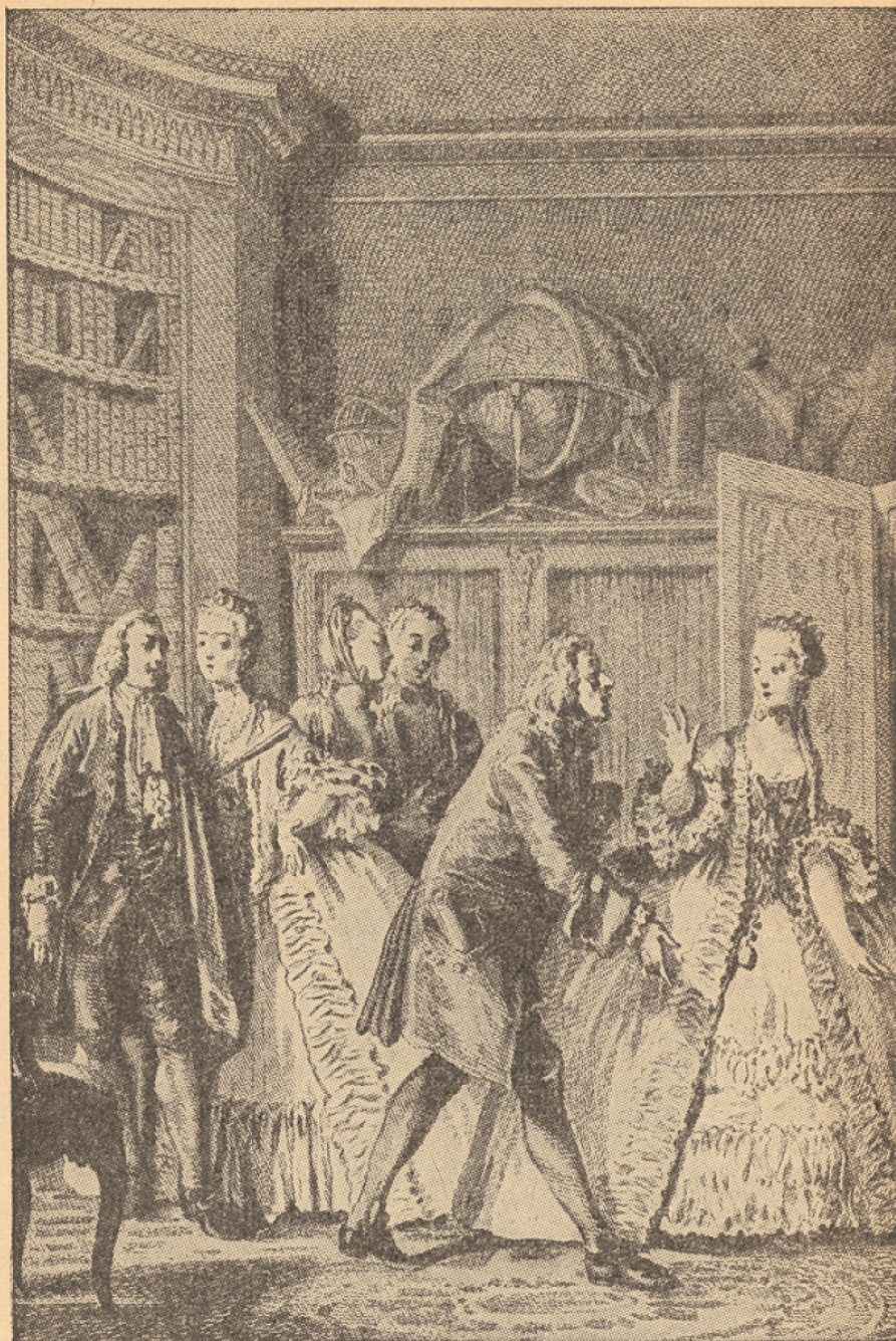
Dessin de J.-M. Moreau le Jeune, pour l'édition du Théâtre de Molière , 1773.