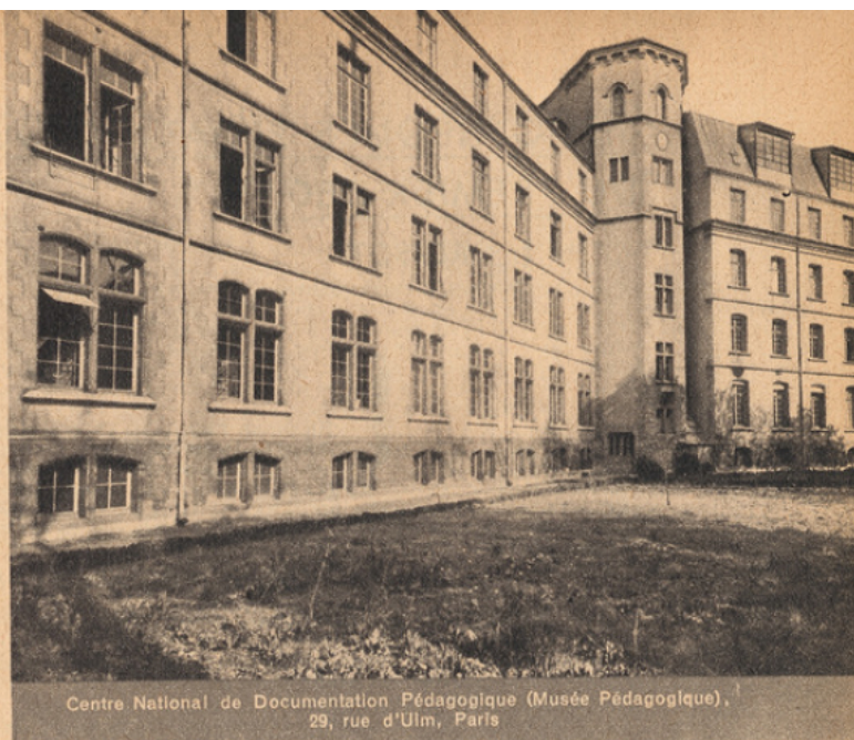
Centre National de Documentation Pédagogique (Musée Pédagogique), 29, rue d'Ulm, Paris

La Bibliothèque du centre national constitue ainsi une sorte de fonds commun des bibliothèques des établissements d'enseignement et permet, par voie de roulement, de compléter la documentation qu'elles mettent elles-mêmes à la disposition de leurs lecteurs.