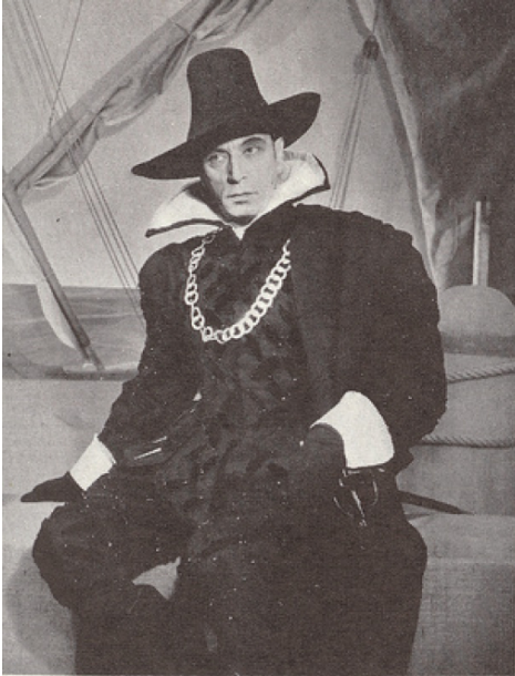
Trois attitudes de Jouvet dans, Dom Juan . Athénée, 1948.