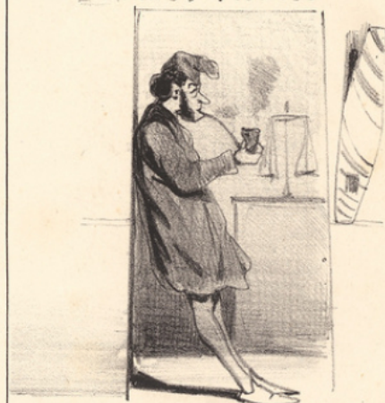
S'il a vaillamment résisté aux colles pendant deux ans, il sort dans les premiers et a droit d'être colloqué dans un bureau de tabac... C'est une position fort avantageuse, on ne risque pas de manger son fonds.