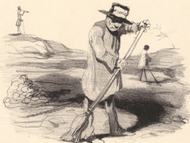
Mais il y a encore les ponts et chaussés... on peut être envoyé du côté de Castelnaudary ou de Brives-la-Gaillarde, surveiller le balayage des routes.