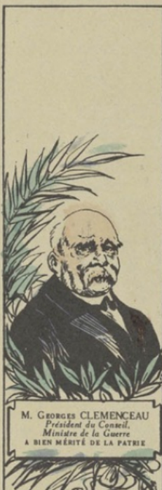
M. GEORGES CLEMENCEAU Président du Conseil, Ministre de la Guerre A BIEN MÉRITÉ DE LA PATRIE