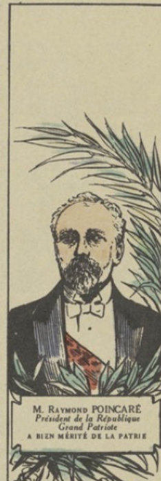
M. RAYMOND POINCARÉ Président de la République Grand Patriote A BIEN MÉRITÉ DE LA PATRIE

Sous la haute présidence de ce grand patriote, le gouvernement de la Défense Nationale, a pu prendre les responsabilités qui exigent la situation, pour la régénération de l'Europe.