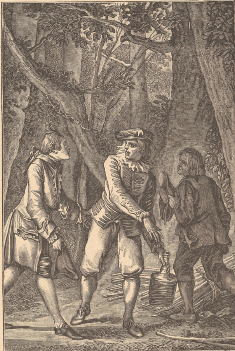
LE MÉDECIN MALGRÉ LUI.