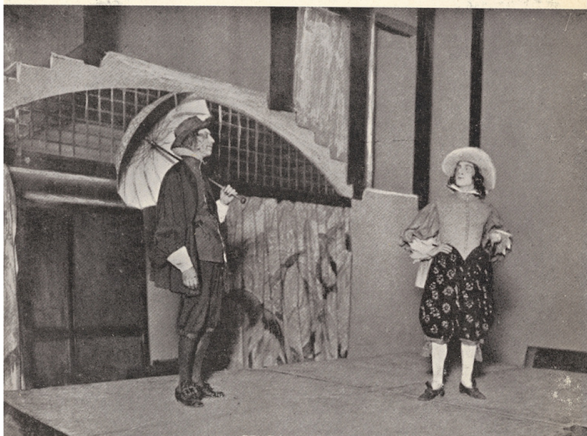
Louis Jouvet, chez Copeau, dans Les Fourberies de Scapin Au verso : Charles Dullin, dans L'Avare (1946)