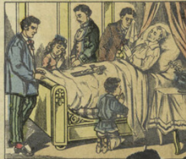
Mort de l'homme

Il est seul !... personne ne s'intéresse à lui, ni ne vient à son secours. Sa servante lui tourne le dos, et semble regretter la perte de ses gages arriérés bien plus qu'elle ne regrette son maître.