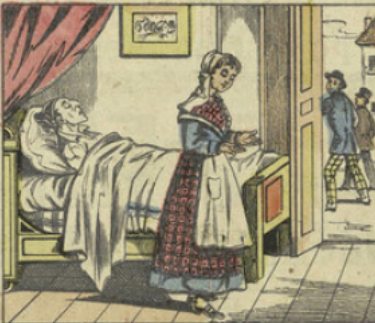
Mort de l'Avare

Monsieur, nous quittons pour fonder une école. — Vous faites une belle œuvre. Je serai heureux d'y contribuer ; il faut répandre partout l'instruction ; n'oublions pas cette excellente parole : Ouvrez des écoles, vous fermerez des prisons.