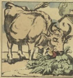
Dans de l'herbe étant caché, Par une vache est avalé.