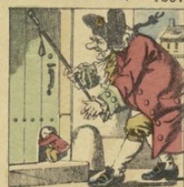
Chassé chez lui, on le poursuit, Par le chatier il s'introduit.