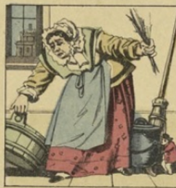
Pour ne pas être fouetté, Poucet s'est ici bien caché.