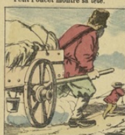
Pour transporter le chanvre fin, Poucet lui donne un coup de main.