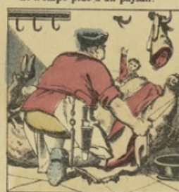
Quand le boucher ouvre la bête, Petit Poucet montre sa tête.