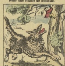
Au bois, un loup le poursuivant, Il grimpe un arbre en un instant.