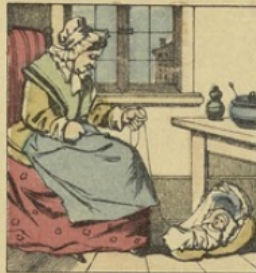
Dans un sabot il est bercé, L'histoire le dit en vérité.