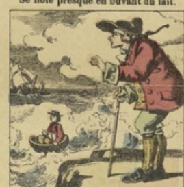
Il vogue, en bravant la tempête, Dans une écaille de noisette.