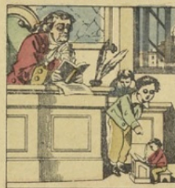
Voyez, dit-on, ceci est beau, Il a la plume d'un moineau.