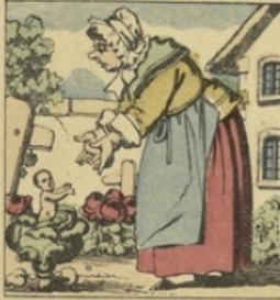
Petit Poucet, le croiriez-vous? Naquit vivant parmi les choux.