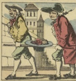
Dans un chapeau se trouvant mal, On le transporte à l'hôpital.