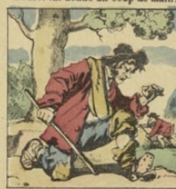
Le mendiant bouche ce trou, Par un autre sort le fioû.