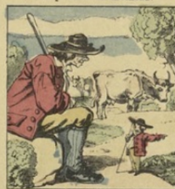
Vacher, il devient très méchant, Et trompe plus d'un paysan.