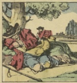
Voit un mendiant couché par terre, A son fricot il fait la guerre.