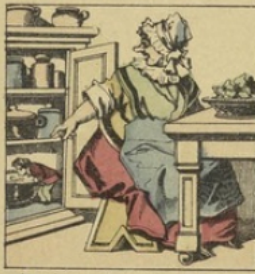
C'est bien ! s'écrie mère Grégoire, Voyant Poucet dans son armoire.