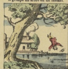
Le fruit lui fait faire un larcin, Il tombe dans l'eau, voici sa fin !