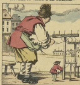
Etant guéri, un vieux cordier Apprend à Poucet son métier.