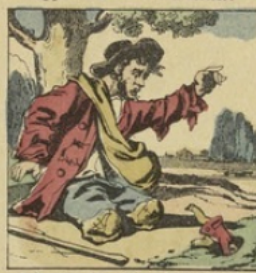
L'homme s'éveille; adieu tripette, Le trou d'une taupe est sa retraite.