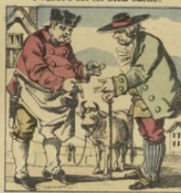
Pour sauver Poucet, le fermier Revend la vache à un boucher.