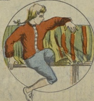
En s'éveillant il se trouve dans une salle immense. Il sort de sa cachette et cherche à connaître l'endroit où il se trouve.