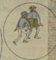
S'étant éveillés, les porteurs trouvent le brancard chargé et l'emportent à destination.