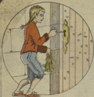
Filoutier, enfant volé dès son enfance par une troupe de saltimbanques, fut si mal élevé qu'il devint voleur.