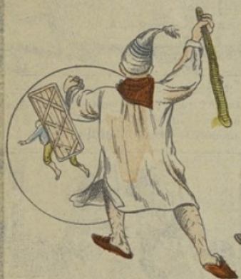
Le paysan qui dormait dans la chambre, s'éveille et le poursuit avec un gros bâton.