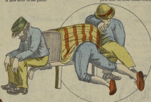
Enfin Filoutier se dégage et avisant un brancard dont les porteurs sont endormis, il se glisse dedans et échappe ainsi aux regards de son persécuteur.