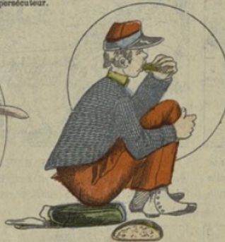
Dans un coin, un soldat mange son pain de munition.