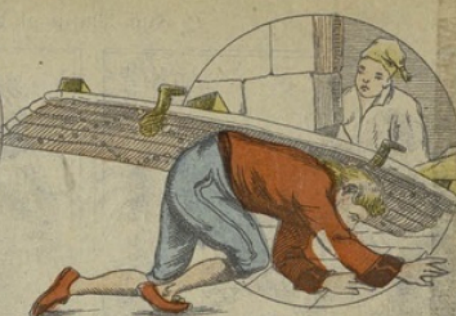
Mais la porte est si lourde qu'elle tombe sur lui et il ne peut se relever. Il se traîne en faisant des efforts désespérés, chargé de la porte dont les clous restent attachés à ses habits.