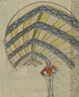
À sa grande joie, il reconnaît qu'il est à l'Exposition et qu'il a plus de chance qu'il s'en méritait. Subitement pris de remords de conscience pour ses petits vols passés, il prend la résolution, avant de commencer ses excursions à la capitale, de demander au travail seul son pain quotidien.

© 1903 Mousson, Manch. VAGNÉ, Imprimeur-Éditeur Dépose