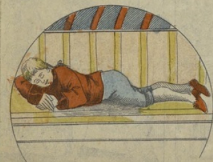
Puis ensuite il s'endort tranquillement.