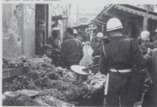
DOC. 19 Un aspect de la « bataille d'Alger » : un militaire muni d'un détecteur d'explosifs - la « poêle à frire » - inspecte un état de fruits et légumes dans la Casbah.

• Une politique européenne avec le vote du projet Euratom (coopération européenne en matière d'énergie atomique) et la signature du traité de Rome (25 mars 1957) qui fonde le Marché Commun. Voir chap. 16.