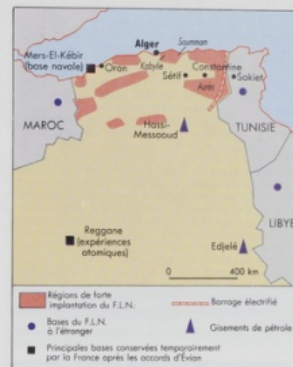
DOC. 20 L'Algérie (1954-1962).

■ Le gouvernement parvient très difficilement à imposer son autorité à l'armée, de plus en plus indépendante. La majorité de gauche qui soutenait Guy Mollet se désagrège : des ministres énoncent des critiques ; deux d'entre eux, Mendès France (hôte aux pouvoirs spéciaux) et Alain Savary, choqué par le détournement de l'avion de Ben