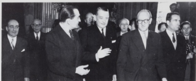
DOC. 16 Ministre Guy Mollet (1 er février 1956) : de gauche à droite, P. Mendès France, le président de la République René Coty, G. Mollet, F. Mitterrand.