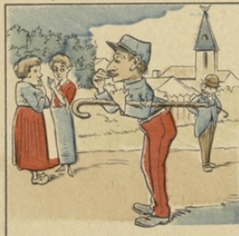
A la vill' tu te distingu'ras Par ta tenue et tes mouv'ments.