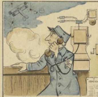
L'avion enn'mi tu signal'ras Pour qu'on l'abatte rapid'ment.