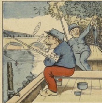
L'Ordinaire amélioreras En utilisant tes talents.