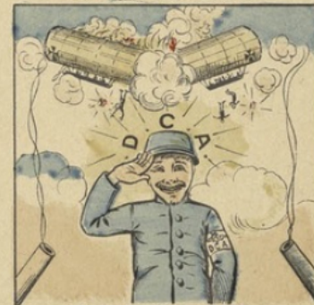
Aucun Zepp'lin ne rentrera Grâce à ton œil très vigilant.