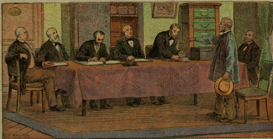
N° 16. — LE PRÊT D'HONNEUR.

Une mention particulière est due aux associations de crédit mutuel, sociétés sans capital, où chacun s'engage de façon illimitée pour son voisin qui emprunte. Le capital social n'est point représenté par une somme d'argent, mais par le travail de tous et la parole donnée. Pour en faire partie, il faut le consentement unanime de tous et la notoriété d'homme honnête et laborieux. L'hypothèque devient inutile. L'emprunteur, muni de son livret individuel renfermant les statuts, trouve alors un créancier contre simple signature.