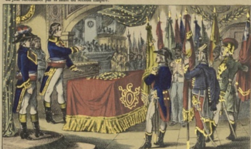
Les drapeaux envoyés par les quatorze armées. Les envoyés des quatorze armées présentent au gouvernement de la République les drapeaux enlevés à l'ennemi. La paix glorieuse du 16 Germinal an III (5 avril 1795) rompt la coalition et assure à la France les résultats des victoires de nos armées.

OLIVIER-PINOT, Éd., à Epinal. Déposé P.V.