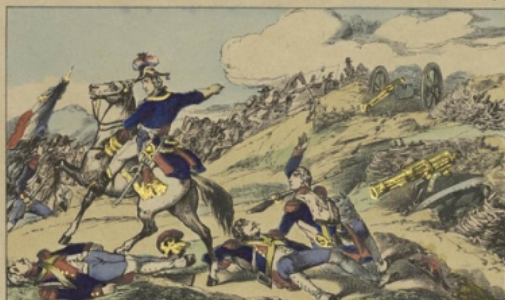
Hoche à Wissembourg repoussant l'invasion de l'Alsace. Les Prussiens et les Autrichiens avaient envahi l'Alsace. Le général Hoche, envoyé par Carnot, tourne les Prussiens, descend à travers les glaces et les neiges des Vosges, sur le flanc des Autrichiens. Le 22 décembre 1793, il emporte d'assaut les redoutes autrichiennes de Froeschwiler. Il bat de nouveau les Autrichiens à Worth, puis à Solsz. Les deux armées autrichiennes et prussiennes se réunissent. Hoche les attaque sur toute la ligne du Rhin aux Vosges. Le 20 décembre, il culbute ses hostiles ennemis qui défendent la hauteur du Gelsberg, en avant de Wissembourg et rejette les Prussiens et les Autrichiens au-delà des lignes de Wissembourg et de Landau. Le territoire français est délivré par l'armée de la République, dans ces mêmes lieux où une autre armée française, aussi brave, mais moins heureuse, devait un jour succomber par la suite du second Empire.