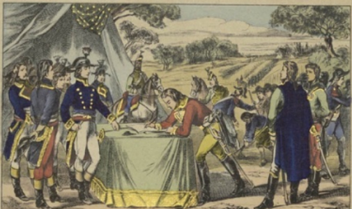
Le général Hoche pacifiant la Vendée. Après la cruelle guerre civile qui a longtemps désolé nos départements de l'Ouest, le général Hoche, vainqueur de l'insurrection, ramène, par sa sagesse et sa générosité, les populations au gouvernement de la République et rétablit l'ordre et la paix dans la Bretagne et dans la Vendée.

OLIVIER-PINOT, Éd., à Epinal. Déposé P.V.