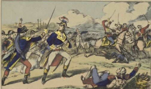
Carnot à Wattignies repoussant l'invasion de la Flandre. Les Autrichiens et les Anglais avaient envahi le département du Nord. Carnot, après avoir organisé l'ensemble de la défense nationale, va prendre la direction de notre armée du Nord, que commandait Jourdan. Les 15 et 16 octobre 1793, Carnot et Jourdan attaquent l'ennemi établi dans la forte position de Wattignies. Repoussés une première fois, ils reviennent à la charge : une masse de cavalerie renverse notre avant-garde ; Carnot, descend de cheval, se met à la tête de notre infanterie, le fusil en main, et la ramène à l'ennemi. La cavalerie autrichienne est balayée, la position est emportée, et cette journée commence la série de nos victoires.