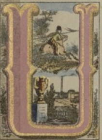
ULAN, USINE, URNE.