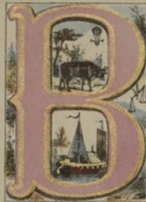
BOEUF, BALLON, BATEAU, BALANCE.