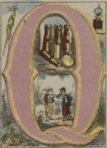
QUELLE, QUILLER, QUINQUET, QUINGILLE.