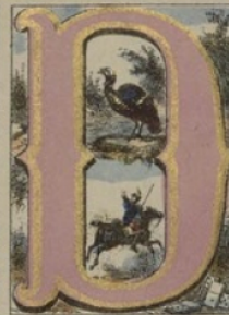
DRAGON, DINDON, DOMINOS.