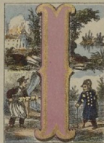
ÎLE, INCENDIE, INVALIDE, INFIRMIER.