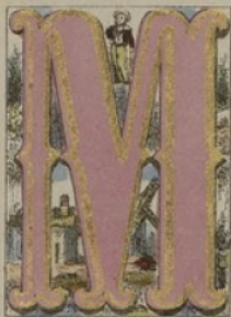
MANN, MAISON, MOULIN.