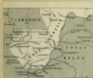
Fig. 7. — Carte du Congo français.