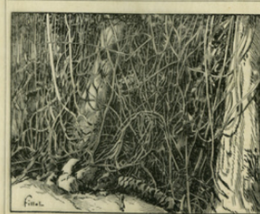
Fig. 11. — Quand le caoutchouc n'est pas cultivé dans des plantations, on l'extrait des lianes des forêts vierges.