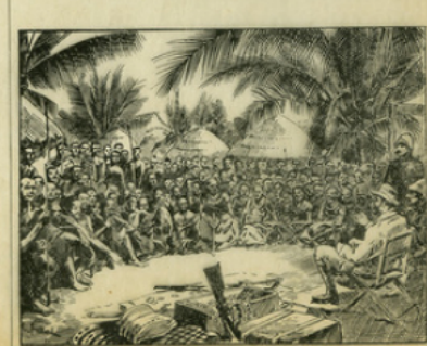
Fig. 6. — Le « palatine » de Brazza et du roi Makoko.