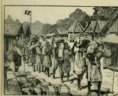
Fig. 10. — Caravane de porteurs arrivant dans une factorerie.