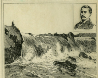
Fig. 3. — Les Stanley-Falls, cataractes du Congo. — Portrait de Stanley.