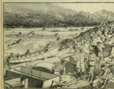
Fig. 4. — Pour franchir les rapides ou passer d'une rivière à une autre, on se sert de canots démontables dont les pièces sont transportées à dos d'homme.