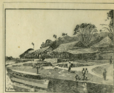
Fig. 9. — Poste militaire sur l'Ogooué.