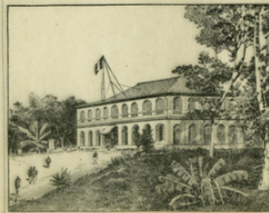
Fig. 5. — Le Palais du gouvernement à Brazzaville : le petit poste militaire est devenu une des villes les plus importantes de la colonie.