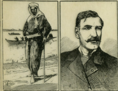
Fig. 1. — Brazza en explorateur (1880). — Brazza en 1905.