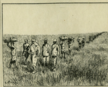
Fig. 2. — Brazza traversant la brousse africaine : tous les bagages doivent être portés à dos d'homme.