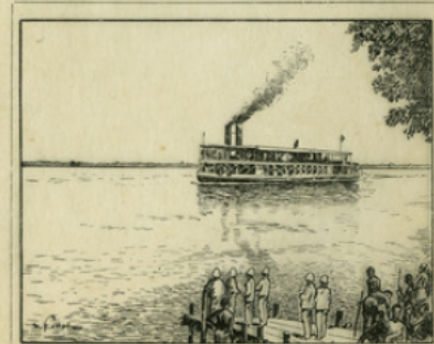
Fig. 12. — Le vapeur 'Dollé', un des bateaux de la flottille fluviale du Congo.