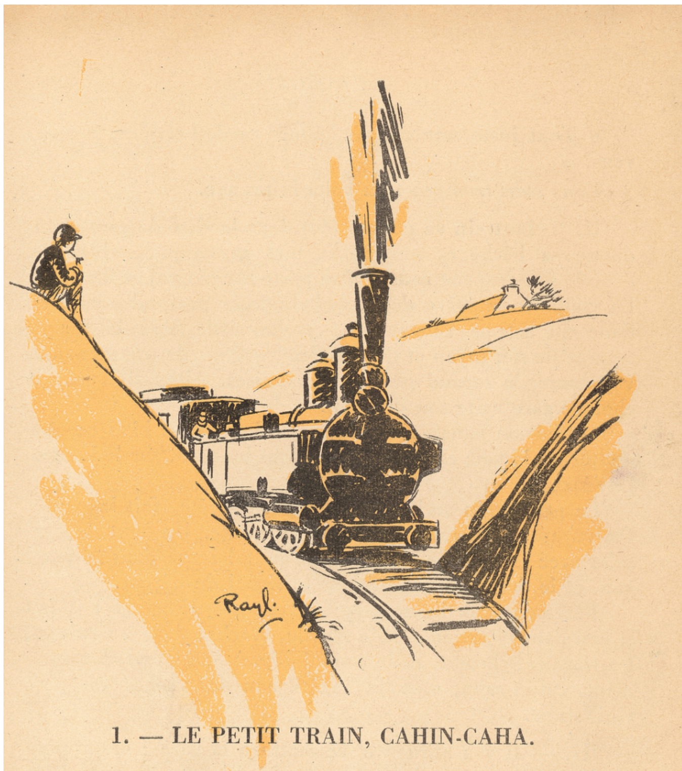
1. — LE PETIT TRAIN, CAHIN-CAHA.