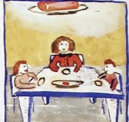
11 h 50 - On se met à table un bifteck pour trois. Ça est le temps des gougots, des asbeufs