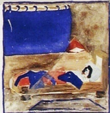
20 h Les bébés sont couchés, le pull, les habits, tout sent de couverture