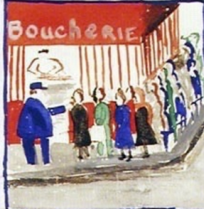
10 h La queue au boucher est interminable. Reviendra-t-elle avec un minuscule bout de viande