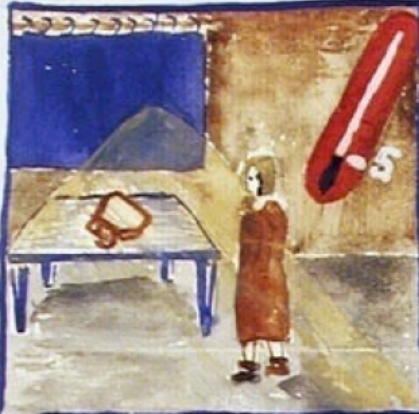
6 h 4 h un soleil - En silence elle s'est levée - Son capucien, ses 2 pulls, sa robe oulatine, son manteau, elle part