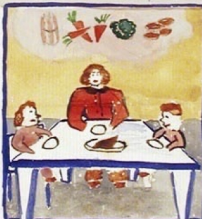
19 h J'ai des Asperges du chou de carottes, des pommes de terre. A volonte! Aujourd'hui Ruba'ba gas