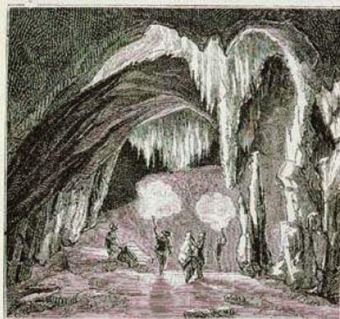
Grotte (à Osselle en France).

Les principales profondeurs que l'on rencontre sur les