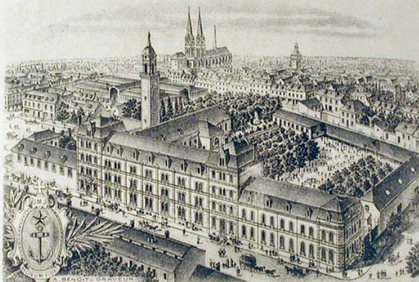
Vue Panoramique du Pensionnat Saint-Gilles