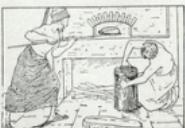
23. La pâte, bien levée, est enfournée* (mise au four); elle cuit et devient du pain.