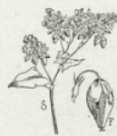
29. Le sarrasin ou blé noir. — Très cultivé en Bretagne et en Normandie. On en fait des galettes et de la bouillie.