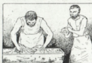
21. La farine forme avec l'eau une pâte que le boulanger pétrit*, puis qu'il mélange avec du levain (voir Bière, p. 68, fig. 112).