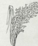
30. Le millet. — La céréale de l'Afrique. On en fait des galettes. On en, donne aussi aux oiseaux.

TEXTE A APPRENDRE. — Les céréales autres que le blé sont le seigle, l'orge, l'avoine, qui donnent un pain grossier; le maïs, le riz, le sarrasin, le millet, qui ne peuvent pas servir à faire du pain. Seul le sarrasin n'appartient pas à la famille des graminées; il est de la famille de Poiseille (polygonées).