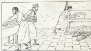
22. Le levain fait gonfler, lever la pâte. Pour qu'elle lève complètement, on la divise en pâtons dans des corbeilles que l'on met au chaud, près du four. La pâte qui lève bien donne un pain léger.