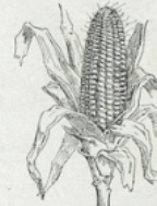
27. Le maïs ou blé de Turquie. — Unique céréale de l'Amérique du Sud. En France, on fait avec sa farine cuite dans l'eau, ou mieux, dans le lait, une bouillie nourrissante et agréable.