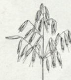
26. L'avoine. — Pain très grossier, noir, indigeste*, d'un goût amer. L'avoine sert surtout à nourrir les chevaux.