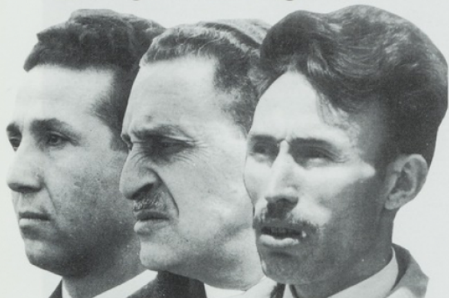
5. Les nationalistes. De gauche à droite : Ben Bella, Ferhat Abbas et Boumediène (photo montage)