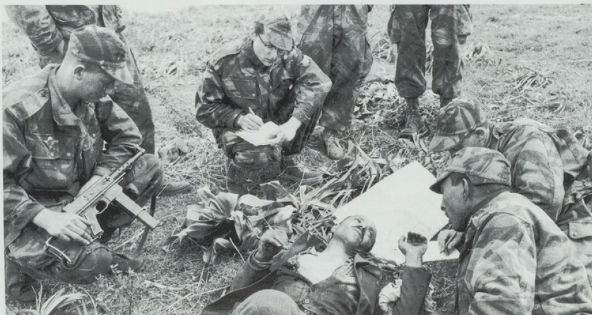
9. Interrogatoire d'un officier de l'ALN (Armée de libération nationale) dans le Constantinois, en avril 1956

D'après C. R. AGERON, Histoire de l'Algérie contemporaine , coll. « Que sais-je ? », PUF, 1964.