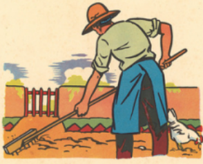
pa pa ra ti sse