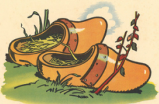
les sa bois de pa pa