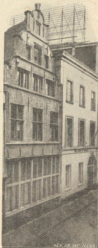
Façade avant 1902.

Vouée par tradition à l'enseignement des arts libéraux et des belles lettres, la Compagnie de Jésus avait compris que les transformations radicales du commerce et de l'industrie avaient, en augmentant l'influence du négociant, rendu absolument nécessaire l'organisation d'un enseignement commercial supérieur.