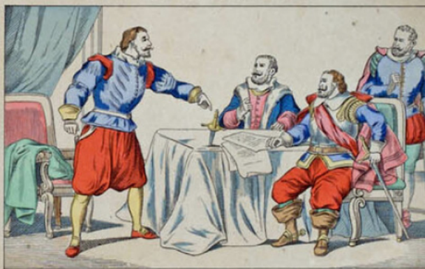
Résistance héroïque du maire Guion