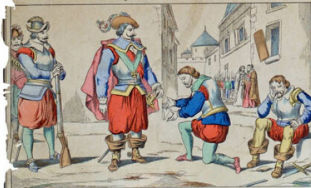
Capitulation de La Rochelle