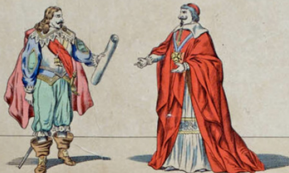
Louis XIII et le cardinal Richelieu