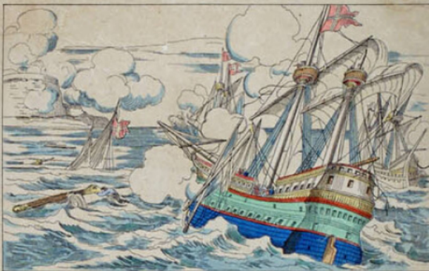
La flotte anglaise vaincue à l'île de Ré