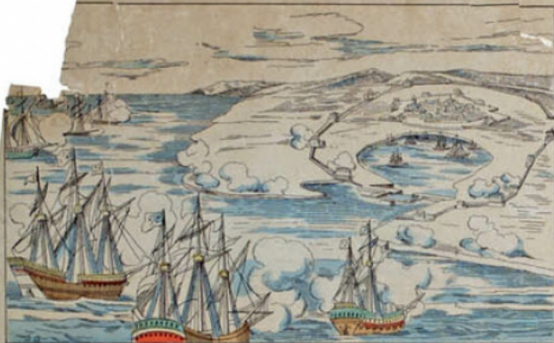
Siège de La Rochelle