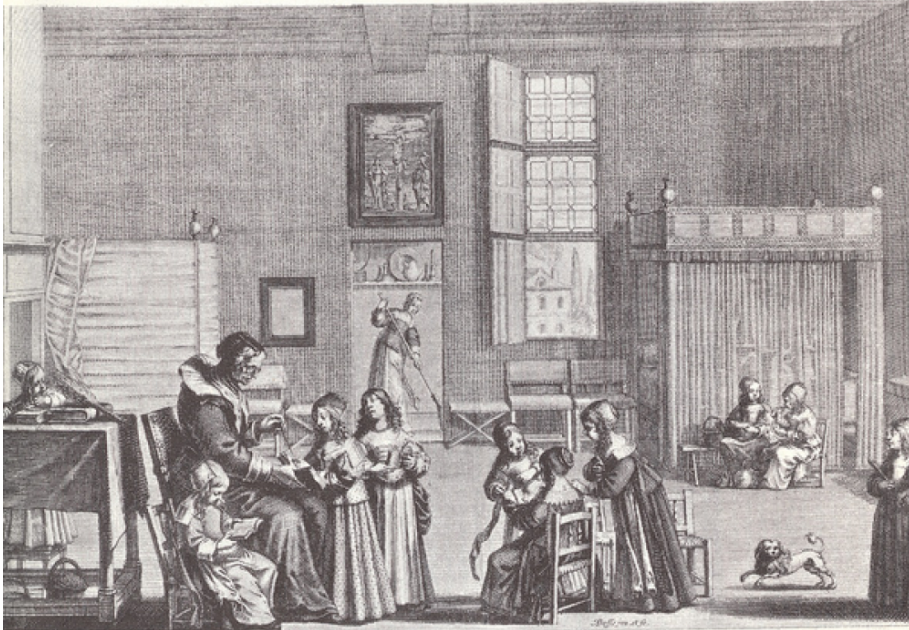
« La maîtresse d'école », vue par Abraham Bosse, évoque l'éducation des filles sous Louis XIII. (v. 571-576)

Leurs ménages étaient tout leur docte entretien / Et leurs livres, un dé, du fil et des aiguilles. (v. 582-583) ►