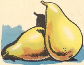
les poi res

u ne étoile - u ne voile - mon doigt la pi voine - la coi ffe - un poi sson