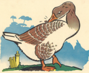
u ne oie