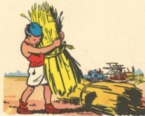
la moi sson

be noit be noit do nne l'a voine à ca di et la pâ té e des oies , il a bat les noix et ra ma sse les poires - X