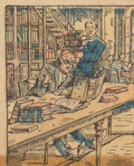
Et se rend directement à la Bibliothèque Nationale dont il consulte les plus poudreux volumes, mais sans succès.