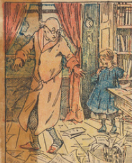
Il se retourne et aperçoit la fillette de son concierge qui vient chercher une réponse à la lettre qu'elle lui a envoyée et qui a tant fait travailler son esprit de chercheur.