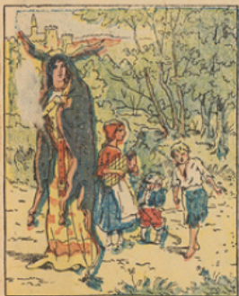
Il était une fois... mais à quoi bon ce préambule ? puisque l'histoire qui suit est la pure vérité :