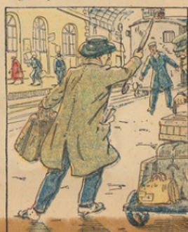
Il décide donc d'entreprendre un voyage dans les différentes provinces de France, espérant y trouver la clé du mystère.