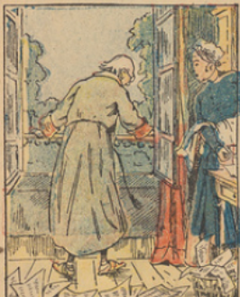
Un beau matin, il entend sous ses fenêtres passer une foule joyeuse et empressée.