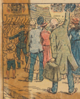
En arrivant à Paris, il assiste au magnifique défilé des vaillantes troupes américaines qu'il acclame frénétiquement.