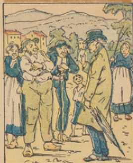
Il gagne ensuite la Normandie où ses recherches sont accueillies de façon peu courtoise.