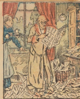
Furieux et décoiffé il rentre au logis, malade, et parcourt les journaux arrivés en son absence.