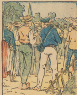
C'est le cortège des bons citoyens qui vont remplir leur devoir en souscrivant au prochain Emprunt de la Défense Nationale.