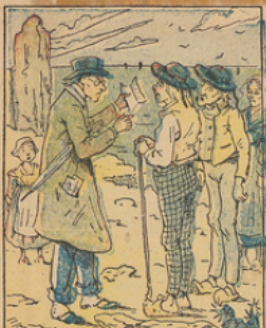
Navré, mais plein d'espoir, il se rend en Bretagne et interroge dans leur langage les habitants du pays qui ne lui procurent aucun éclaircissement.