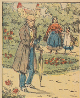
Un vieux savant retiré à la campagne suscitait les rires des honnêtes villageois, tant il était distrait et uniquement plongé dans ses études linguistiques.