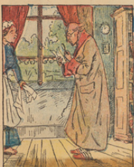
Les lumières que lui procure sa brave cuisinière ni même l'inspection à la loupe du document ne lui apportent la solution.