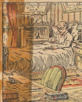
Un beau matin, à son réveil, il trouva dans son étui à lunettes...