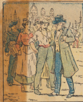
Désespéré, il se rend à Marseille et parcourt la Cannébière sans plus de résultat.