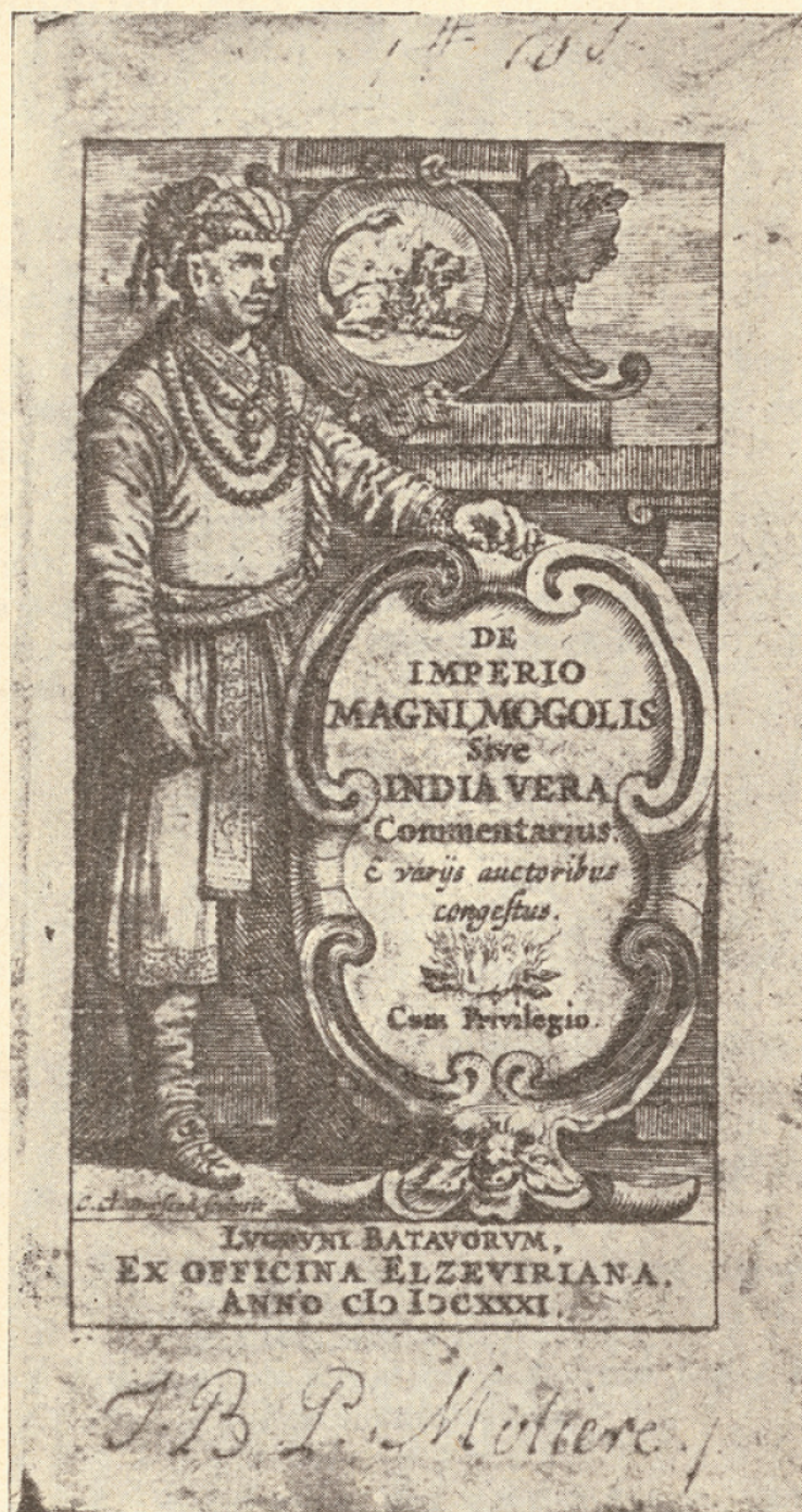
FIG. 2. — Signature autographe de Molière.