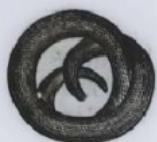
Trichine dégagée de son kyste.