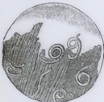
— Embryons de Trichines dans les muscles striés.