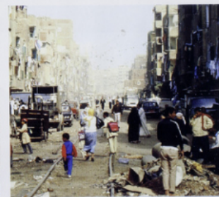
4 Le Caire (Égypte).